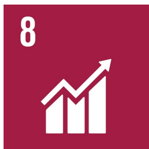
Dôstojná práca je Cieľom udržateľného rozvoja č. 8

Zásadný rozdiel medzi MDG a SDG je v udržateľnosti. Miléniové rozvojové ciele sa stali terčom kritiky, keďže sa venovali len sociálnemu rozvoju – vzdelávaniu, zdraviu, hladu a potravinovej bezpečnosti. Nové ciele sú najmä o udržateľnosti. Niektoré krajiny síce v rámci MDG splnili svoje ciele, ale často na úkor životného prostredia, klímy a planéty vôbec. Skvelým príkladom je Čína. Práve ekonomický rast Číny a odstránenie chudoby mali podľa kritikov vplyv na niektoré ukazovatele MDG. Najľudnatejšia krajina sveta znížila počet chudobných zo 60 percent na 12 (2010). Oproti tomu napríklad dlhodobo najchudobnejšia Subsaharská Afrika nespriala pokrok žiadny, skôr naopak, potravinová bezpečnosť a extrémna chudoba sa dokonca zhoršili.